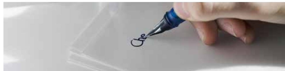
Médiathèque Valais JPD/SM

/ Informations / 027 722 20 60 info@des-livres-et-moi.ch www.des-livres-et-moi.ch